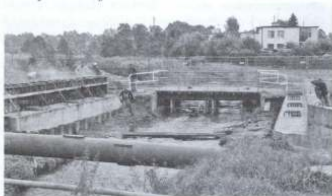
Budowa mostu na Okalicy