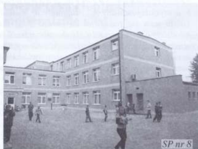
SP nr 8

Trwa kompleksowa termomodernizacja lęborskich szkół. Inwestycja współfinansowana jest przez Unię Europejską ze środków Funduszu Spójności. Całkowita wartość projektu ok. 13 mln zł, kwota dofinansowania wynosi ponad 6 mln zł. Inwestycja obejmuje szkoły: SP nr 3, 5, 8, Zespół Szkół nr 3 oraz Gimnazjum nr 1 i 2. Prace rozpoczęły się w lipcu 2010, a zakończą w grudniu 2011.