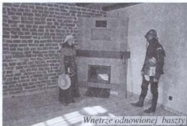
Wnętrze odnowionej baszty

17 i 18 września przy baszcie nr 32 u zbiegu ul. Reja i Korczaka odbędzie się plenerowa impreza „Zdobywanie baszty”. W piątek (17.09) o godz. 20 zostanie wyświetlona tam multimedialna prezentacja „Średniowieczny Lębork”. Ciekawie zapowiada się sobota (18.09) w godz. 14-18 będzie można zwiedzać obozowisko rycerzy, kosztować średniowiecznych potraw i podziwiać uzbrojenie i kostiumy. O godz. 18 na boisku Zespołu Szkół nr 3 odbędzie się turniej bojowy i luczniczy. Po nim z koncertem wystąpi zespół muzyki dawnej „Incantare” (g. 20). Imprezę zakończy „ognisty” spektakl zespołu Fire Dance z Bytowa (g. 21) – Baszta przy ul. Korczaka nie tylko w tym dniu będzie pod władaniem rycerzy – mówi Marcin Ramczyk z Lęborskiego Bractwa Historycznego, współorganizator imprezy. - Nasze bractwo jest partnerem w projekcie, w baszcie znajdują swoją siedzibę rycerze. To ważne, by lęborskie obwarowania „żyły” i to jest krok w tym kierunku.